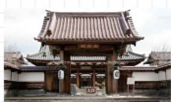
◎会津藩校 日新館 多くの優秀な人材を輩出した 全国屈指の名門藩校です。