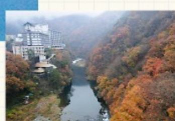
◎会津は温泉がたくさん!

冬は雪が多くスキー・スノーボードや温泉巡り! 夏になればキャンプやパラグライダー、 猪苗代湖でのマリンスポーツ、 裏磐梯や尾瀬でのトレッキングも楽しめます。 最近ではSLや会津鉄道も人気。お祭りも多く、 たくさんの方で賑わいます。