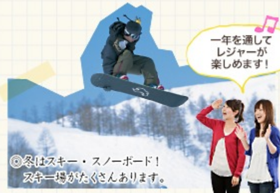
◎冬はスキー・スノーボード! スキー場がたくさんあります。