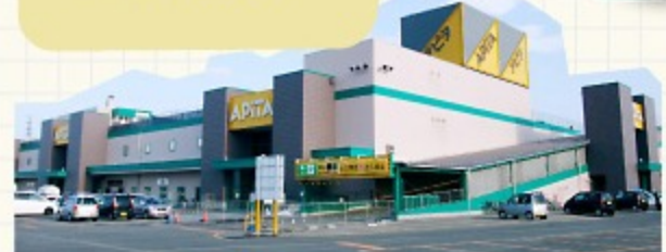
◎会津オリンパスのすぐ隣には ショッピングモール・アビタがあり買い物に便利です。