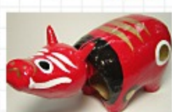
◎起上りこぼしと 赤べこ

会津人は、生真面目で一本気。 「会津に来たときはとっつきにくくて泣き、 馴染めば人情の深さに泣き、 去るときはその人情と離れ難く泣く」という 「会津三泣き」の言葉が、 そんな会津気質をよく表現しています。 その心はものづくりの面にも生きており、 会津塗や桐箆笥、起上り小法師、 会津駄菓子などの伝統品が今も愛され、 暮らしの中に息づいています。 本社から、世界から、絶大な信頼を得ている 会津オリンパスの「技術者魂」は、 この町の風土で磨かれるのかもしれない。