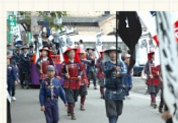
◎会津最大の会津まつり