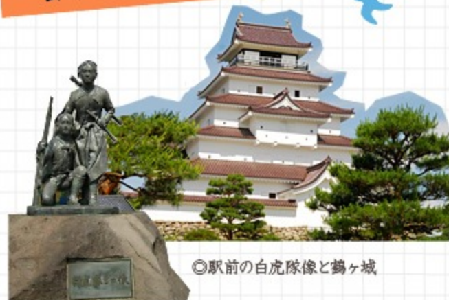
◎駅前白虎隊像と鶴ヶ城