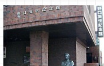
◎野口英世博士生家 あの野口英世博士の生家。 すぐそばは猪苗代湖です。

会津オリンパスのある会津若松市は、 磐梯山や猪苗代湖などの自然に囲まれた城下町。 古事記に登場するほど歴史が古く、 新撰組との関わりや白虎隊の悲劇でも知られています。 野口英世の生誕の地としても有名な、 歴史観光都市として人気の高い都市です。