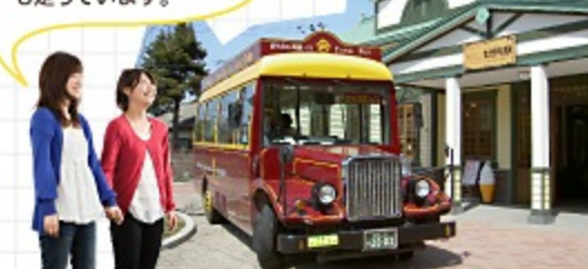
◎七日町駅とハイカラさん号 七日町駅の中のカフェが人気です。