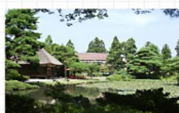
◎御菜園 江戸時代に造られた庭園があります。 茶席では抹茶を飲みます。