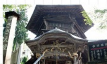
◎さざえ堂(国指定重要文化財) 一度も同じ道を通ることなく 堂内を参ることができるお堂です。