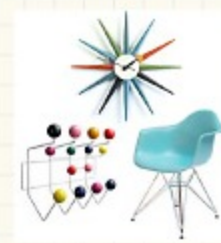
◎ブランド家具や、 かわいい雑貨を揃えた ショップがたくさん!